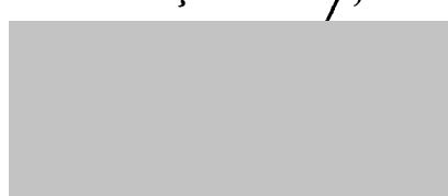
Senator Liviu-Marian POP